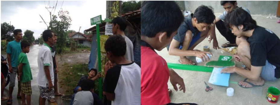
Gambar 4.6. Pengadaan Papan Nama Jalan