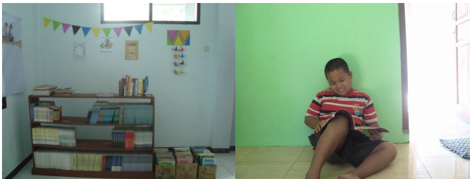
Gambar 4.9. Pengadaan Taman Baca