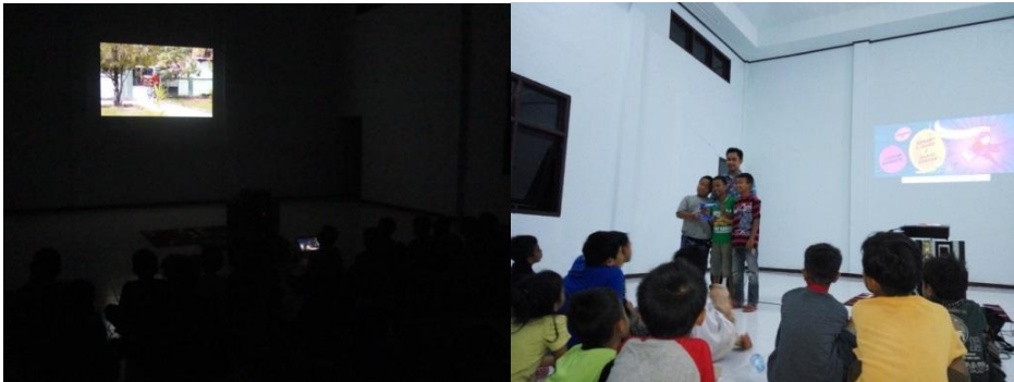
Gambar 4.5. Nonton Bareng