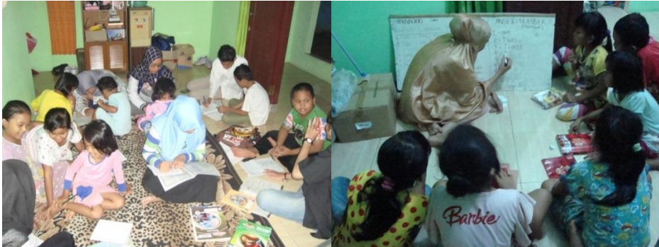
Gambar 4.4. Suasana Rumah Belajar