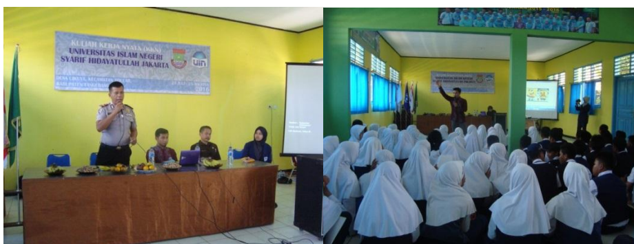
Gambar 4.1. Sosialisasi dan Penyuluhan Anti Narkoba