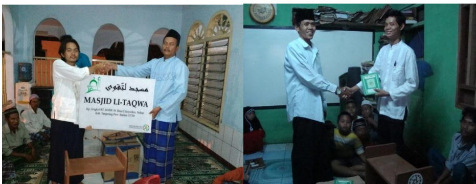
Gambar 4.7. Wakaf mushaf al-Qur'an dan Papan Nama Masjid