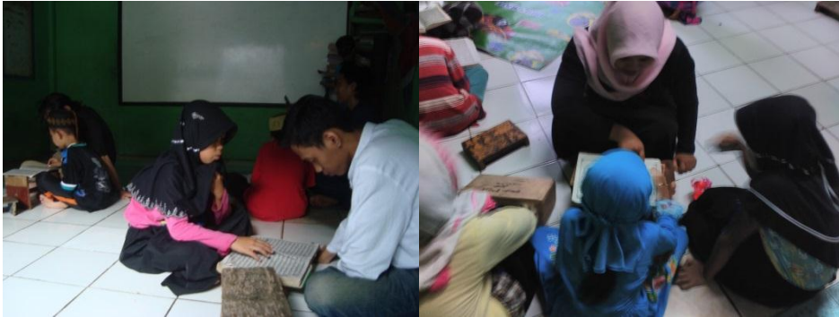
Gambar 4.3. Mengajar di TPA Al-Barokah