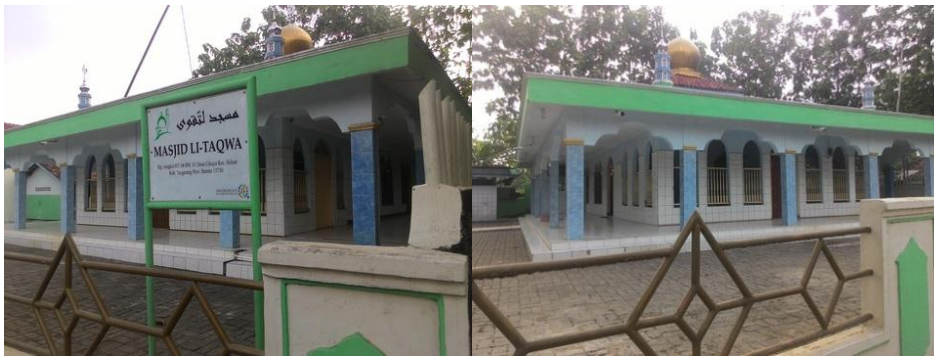
Gambar 3.9: Masjid Li-Taqwa

Terdapat lima agama yang dianut oleh masyarakat Desa Cikuya, yaitu Islam, Kristen, Katolik, Hindu dan Budha. Islam sebagai agama mayoritas yang dianut oleh masyarakat membuat banyaknya masjid yang didirikan. Untuk tempat peribadatan agama lain, penulis tidak melihat adanya Gereja, Pura, maupun Vihara di Desa Cikuya.