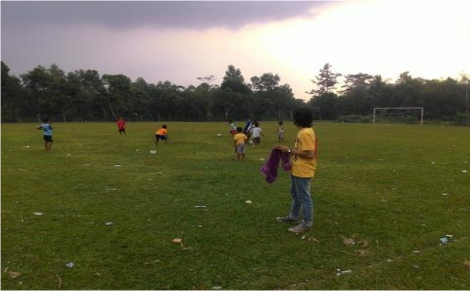
Gambar 3.4: Lapangan Sepak Bola