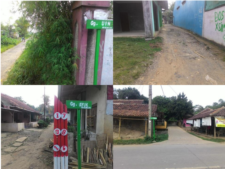
Gambar 3.7: Gang