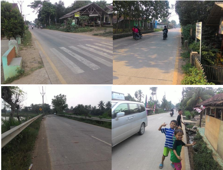
Gambar 3.6: Jalan

Jalan merupakan prasarana yang sangat penting di manapun. Jika tidak ada jalan maupun jalan tersebut rusak, maka akses ke suatu wilayah akan terganggu dan membuat wilayah tersebut sulit untuk maju. Di wilayah Tangerang, pemerintahnya sangat peduli terhadap kondisi jalan. Untuk Desa Cikuya, jalan raya utama kondisinya cukup baik karena sudah dicor beton. Tidak hanya itu, jalannya sudah dilengkapi dengan marka jalan dan rambu lalu lintas. Namun, bagi para pejalan kaki sangat berbahaya, tidak tersedianya trotoar. Selain itu, disebelah kiri maupun kanan jalan tidak adanya saluran air, sehingga, ketika hujan turun banyak air yang menggenang di tengah jalan.