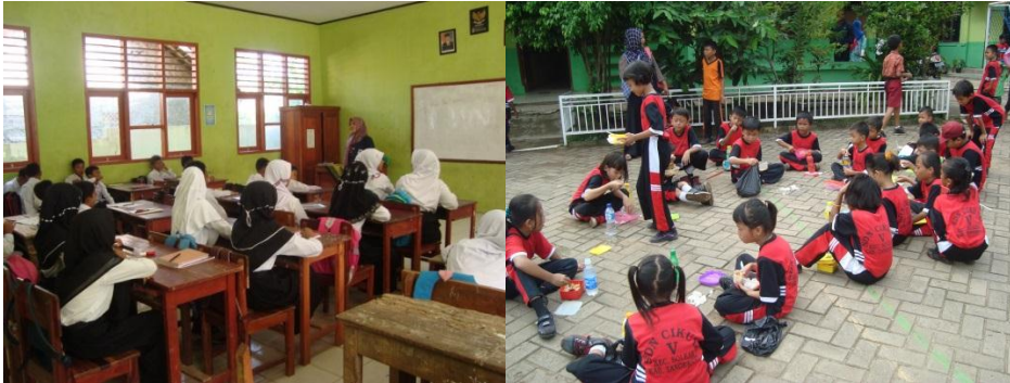
Gambar 4.2. Mengajar di SDN Cikuya V