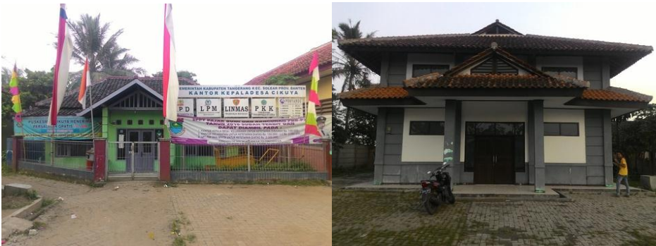
Gambar 3.2: Kantor Desa (sebelah kiri) dan Gedung Serba Guna (sebelah kanan)

Selain itu, pemerintahan Desa Cikuya juga memiliki gedung serba guna (GSG) yang lokasinya tidak jauh dari kantor desa. Gedung ini cukup besar dan bisa menampung kurang lebih 300-500 orang. Kondisi gedung ini cukup bagus, bangunannya kokoh, tembok dan lantai yang bersih, serta tersedia halaman yang cukup luas untuk parkir kendaraan. Namun, di beberapa sisi ada kondisi yang kurang baik, seperti di jendela ada beberapa kayunya yang sudah lapuk, kamar mandi yang kotor, dan halaman gedung yang ditumbuhi oleh rumput-rumput liar.