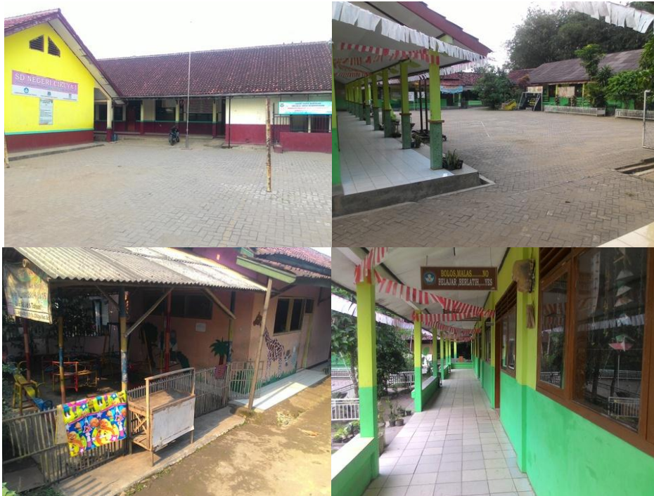
Gambar 3.3: Lembaga Pendidikan di Desa Cikuya

Pendidikan Dharma Bhakti (MI, MTs, SLTP, dan SMU), dan Pendidikan Anak Usia Dini (PAUD) Li-Taqwa. Kondisi semua lembaga pendidikan tersebut cukup baik, memiliki fasilitas seperti perpustakaan, UKS dan lapangan, serta lingkungan yang bersih.