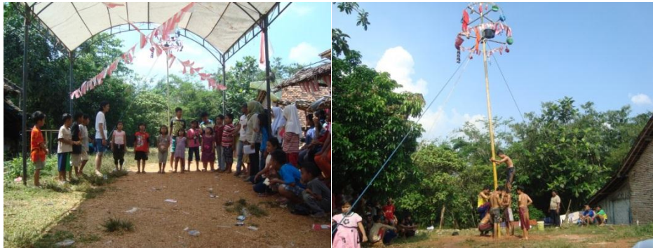
Gambar 4.8. Perayaan 17 Agustus