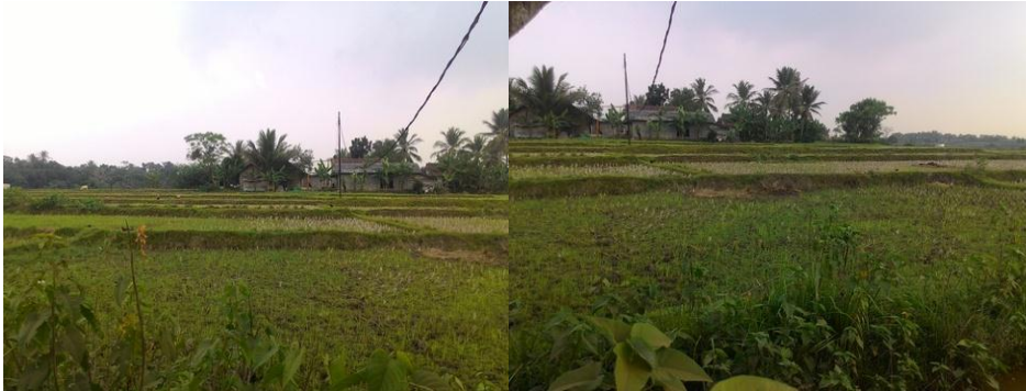
Gambar 3.8: Persawahan